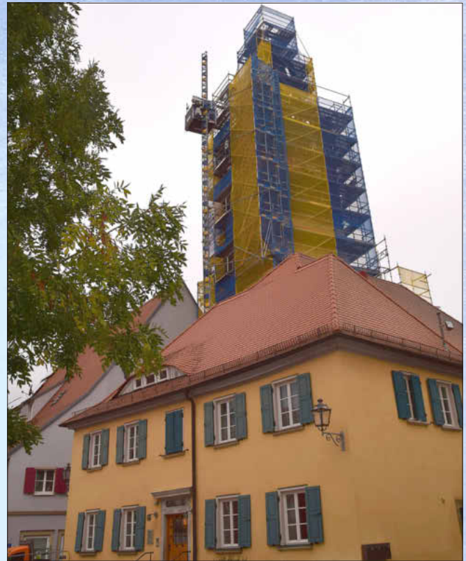
Eingerüstet präsentiert sich noch für einige Zeit der Würzburger Torturm.