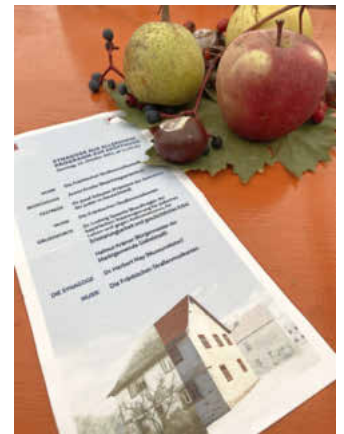
Eröffnung der Synagoge mit musikalischer Begleitung.