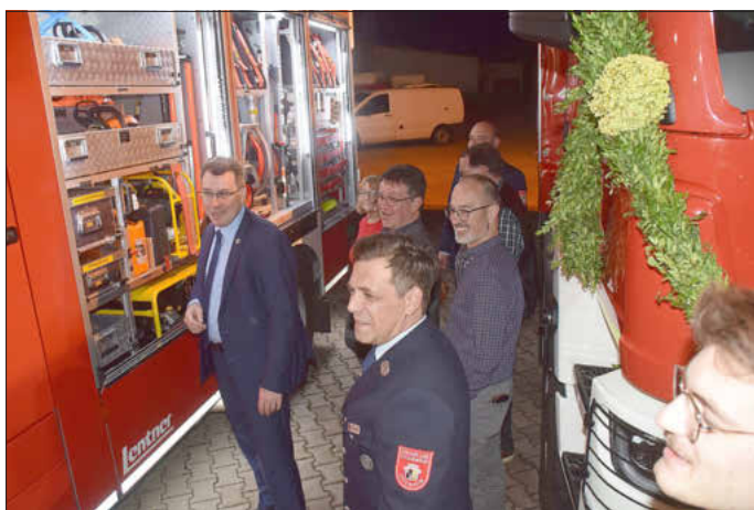
Die neuen Fahrzeuge durften natürlich besichtigt werden.