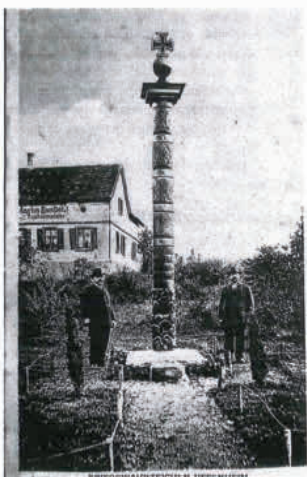
Preisträger des Deutschen