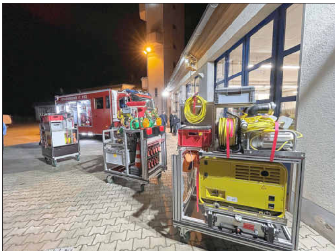
Ein Teil der Beladung des neuen Katastrophenschutzfahrzeugs.