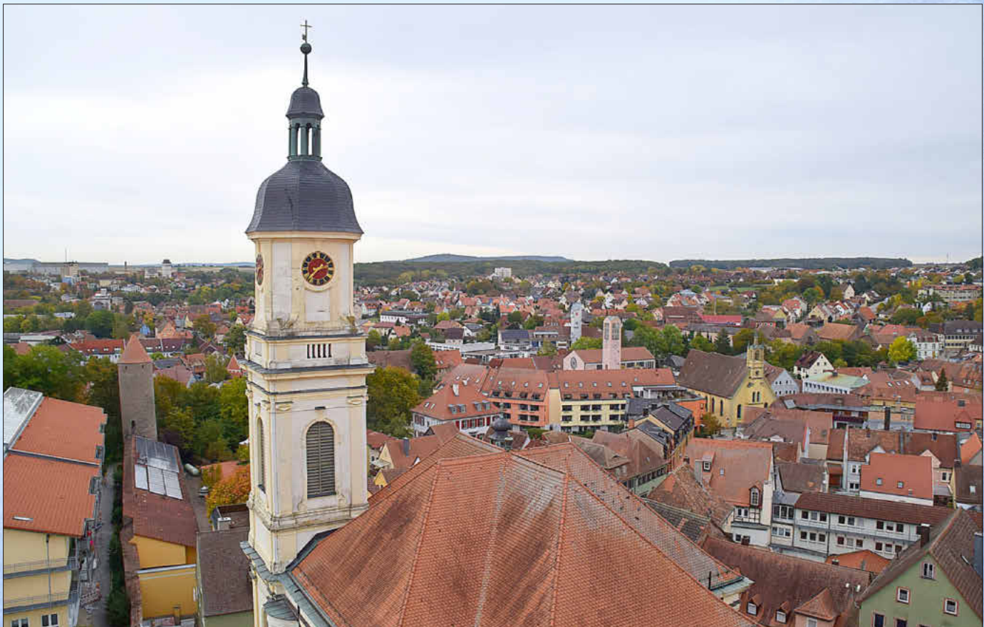
Eine herrliche Aussicht auf Uffenheim hatte man ganz oben vom Gerüst am Würzburger Torturm.