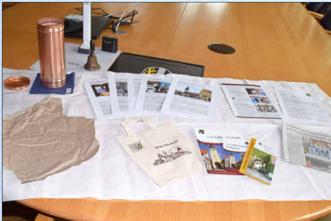
Diese Dinge kamen in die Zeitkapsel.