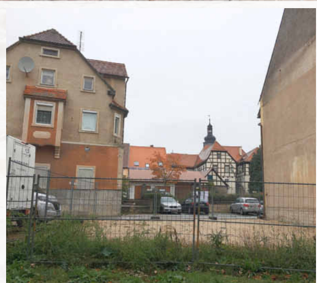
Auch das ist Innenentwicklung: Durch den Abriss am Schweinemarkt 6 wird Platz für Neues geschaffen. Hier soll ein Pavillon für kulturelle Veranstaltungen entstehen und das Areal insgesamt aufwerten.