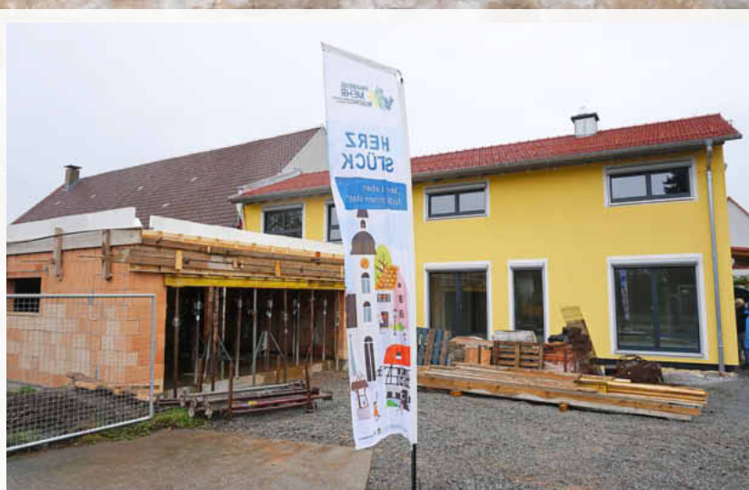
Anstatt für den Neubau im Siedlungsgebiet, entschied sich Bauherr Daniel Himmer für den Abbruch der alten Maschinenhalle und den Ersatzbau eines energieeffizienten Einfamilienhauses.