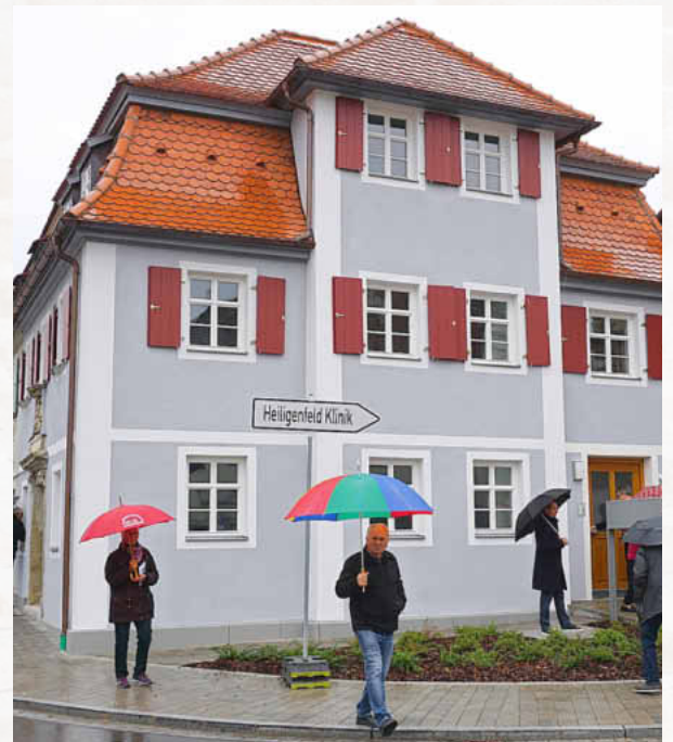
In dem Gebäude von 1798, Ansbacher Straße 26, sind durch die Sanierung drei moderne Einraumwohnungen entstanden.

Von besonderem Interesse für die Besucher war das Gebäude der Familie Grünes, welches 2015 bis 2016 umfassend saniert und hierin modernes Wohnen und Arbeiten unter einem Dach realisiert wurde. Aber auch die vor kurzem fertiggestellten Mietwohnungen in der Ansbacher Straße 26 wurden ausführlich besichtigt. Das spätbarocke Gebäude von 1798 ist von herausragender städtebaulicher Bedeutung, erklärte Stadtführer Holzmann. Um die Verkehrssituation im Einmündungsbereich der Ansbacher/Rothenburger Str. zu entschärfen und gleichzeitig dem Denkmalschutz gerecht zu werden, sei das Gebäude als Kompromiss verkürzt worden, so Lampe. In der Oberen Mühle lud das Ehepaar Böcker zu einem Rundgang ein. Erbaut ab 1750 als Mühle und Landwirtschaft, wurden die Gebäude von 1983 bis 2011 unter Berücksichtigung einer fachgerechten Restaurierung der alten Substanz und des Denkmalschutzes zu einem Wohnhaus mit Gästezimmern und Gaststätte umgebaut. Informationen zur energetischen Sanierung erhielten die Besucher im Windstützpunkt. Das 1901 erbaute Gebäude beherbergte das ehemalige Elektrizitäts-Werk bevor es 2016 eine neue Nutzung als Ausstellungsräumlichkeiten für Windenergie erhielt.