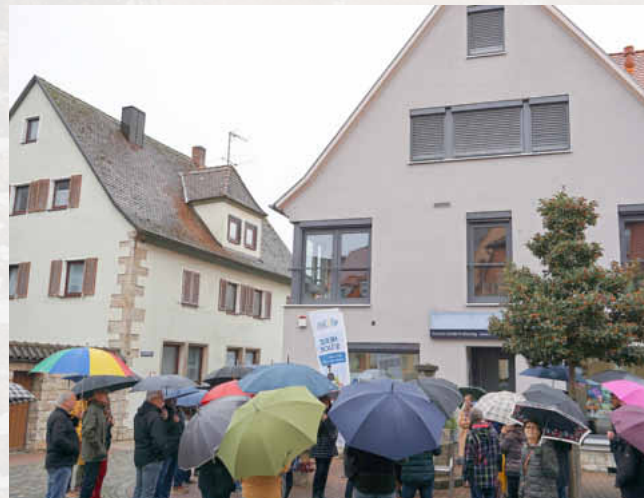
Eine umfassende Sanierung des Gebäudes Friedrich-Ebert-Str. 8 von 1954 ermöglicht modernes Wohnen und Arbeiten in der Innenstadt.

„Mein Leben findet Innen statt“ lautete das Motto der landkreisweiten „Aktionstage Innenorte“ an denen sich die beiden Kommunen Uffenheim und Weigenheim der Kommunalen Allianz A7 Franken West beteiligten. Die Besucher konnten sich am Aktionstag zu Themen rund um das Bauen, Sanieren und Wohnen im Ortskern informieren.