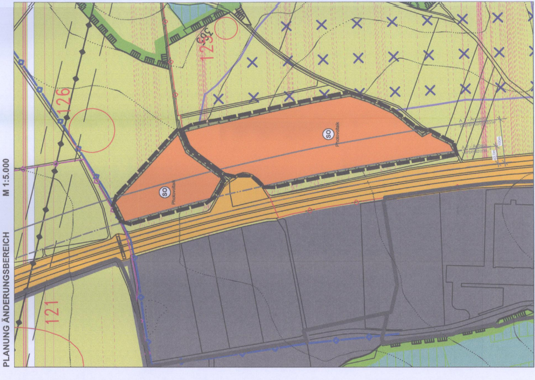
Kartengrundlage: Flächennutzungsplan, digitalisierte Fassung