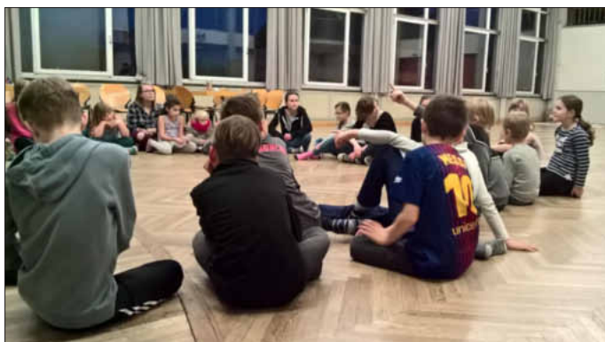
Stadthallenkids aus Vor-Corona-Zeiten