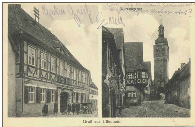
Ein Blick auf die Alte Post und das Würzburger Tor, mit handschriftlichem Gruß aus dem Jahr 1929.

Wo es eine Herberge gibt, da gibt es meist auch Gäste. Heute reihen sich Regale voller Schellackplatten, Instrumente und Literatur im oberen Stockwerk aneinander, dort, wo einst einer schlief, der immer wieder auf seiner Durchreise nach Bad Brückenau in Uffenheim rastete: