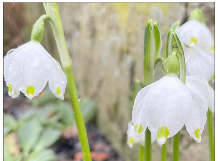
Die Frühlingsknotenblume blüht bald wieder. Der Dorfverein Pfeinach lädt dann zu Märzenbecherwanderungen ein

dem Spaziergang durch den Wald stärken möchte, für den steht der Dorfverein wieder an zwei Sonntagen mit Kaffee und Kuchen bereit. Aus dem Dorfgemeinschaftsbackofen gibt es Flammkuchen. Die Termine für die beiden Sonntage gibt der Verein auf seiner Homepage https://maerzenbecher.wixsite.com/mrzenbecher rechtzeitig bekannt.