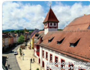
Historisches Rathaus