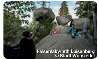
Felsenlabyrinth Luisenburg