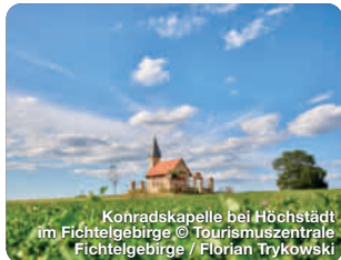
Konradskapelle bei Höchstädt im Fichtelgebirge

TreffpunktDeutschland.de/wunsiedel-region