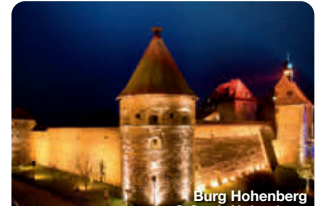
Burg Hohenberg