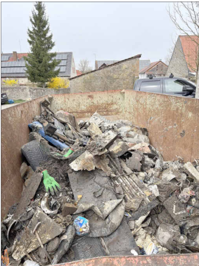
Das Ergebnis der Müllsammelaktion an der Gollach und Steinach

Nach getaner Arbeit freuten sich alle Helfer und Helferinnen auf eine Vesper und Getränke, welches traditionell vom letztjährigen Fischerkönig spendiert wird.