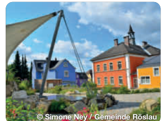
© Simone Ney / Gemeinde Rösau