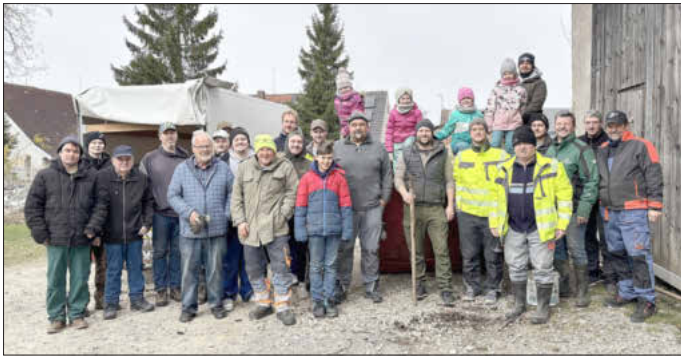
Der Verein freute sich über die zahlreichen Helfer beim Bachputzen