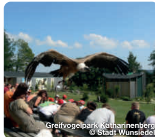
Greifvogelpark Katharinenberg