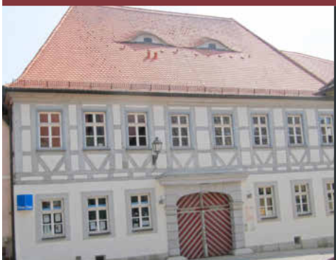
Wolfgang Lampe Erster Bürgermeister