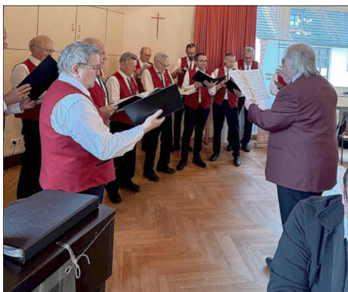
Neben dem Liederkanz 1838 Uffenheim e.V. erfreute der Männergesangverein Markt Einersheim mit fröhlichen Weisen die Anwesenden.

Erwachsene: 7,00€ Jugendliche: 6,00€ Kinder: frei