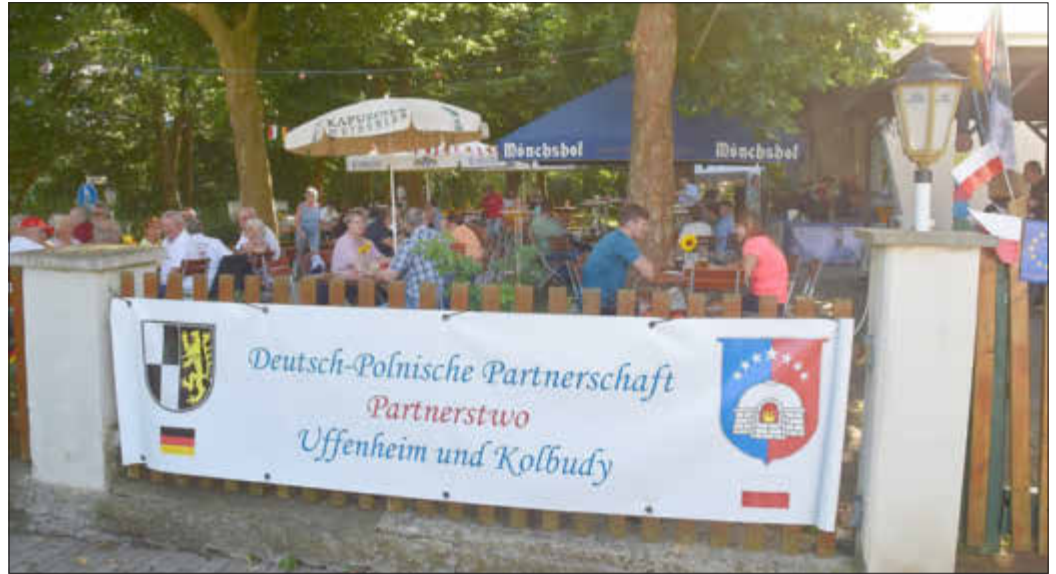
Im Biergarten der Alten Kelterei fand das zweite Deutsch-Polnische Bierfest statt.