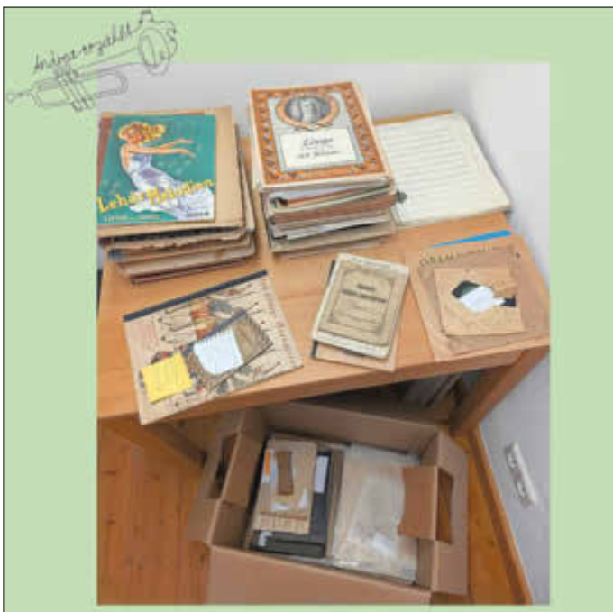
Von Schallplatten bis Melodieheften und Instrumentenschulen, von allem ist etwas im Projekt dabei.