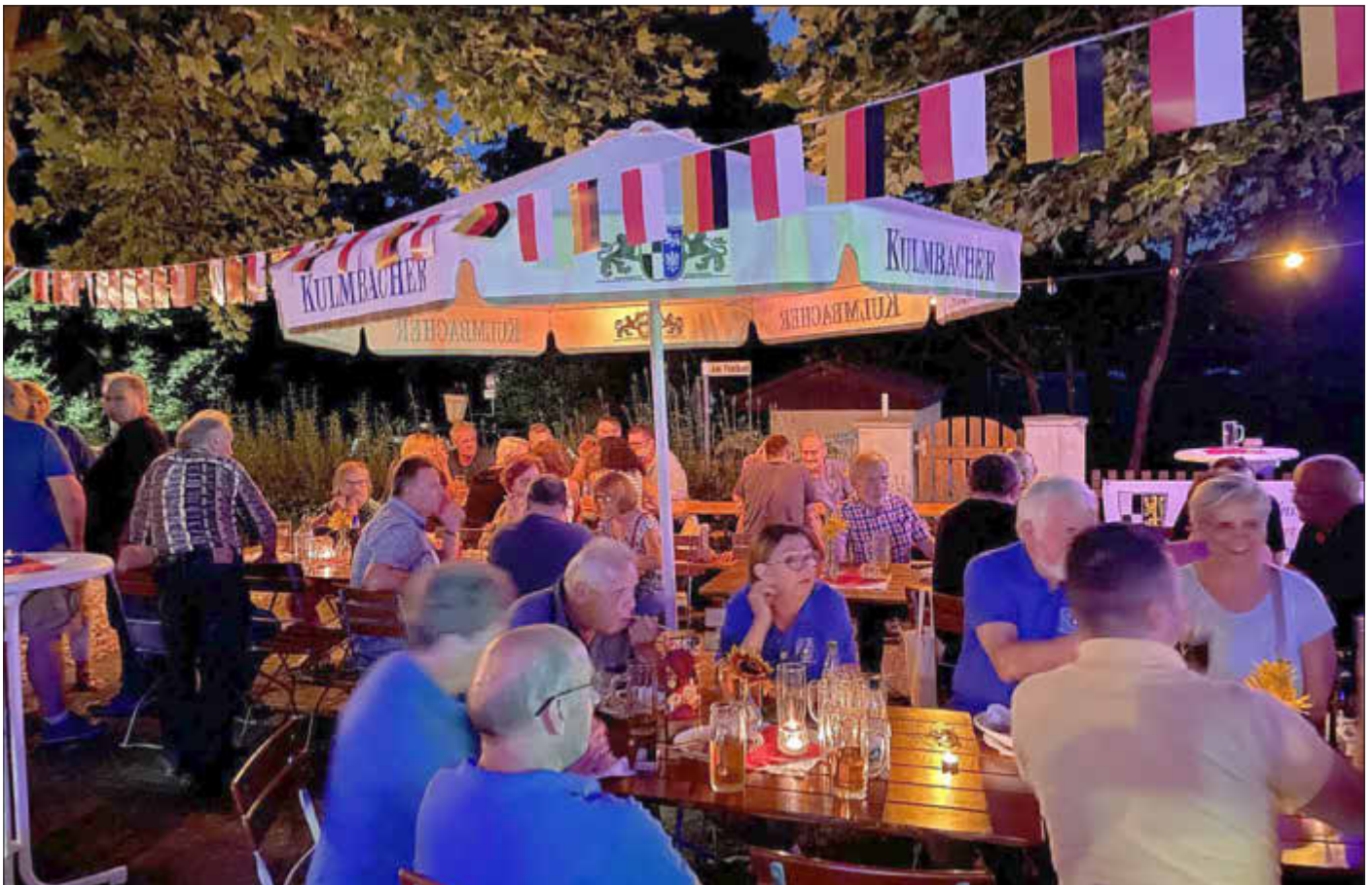
Gefeiert wurde bis spät in die Nacht.