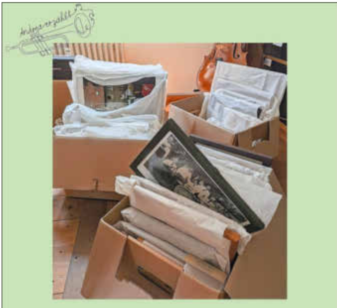
In diesen Kartons befinden sich über sechzig Bilder, die unter anderem die Stadtkapelle Leutershausen und den Posaunenchor Leutershausen zeigen.