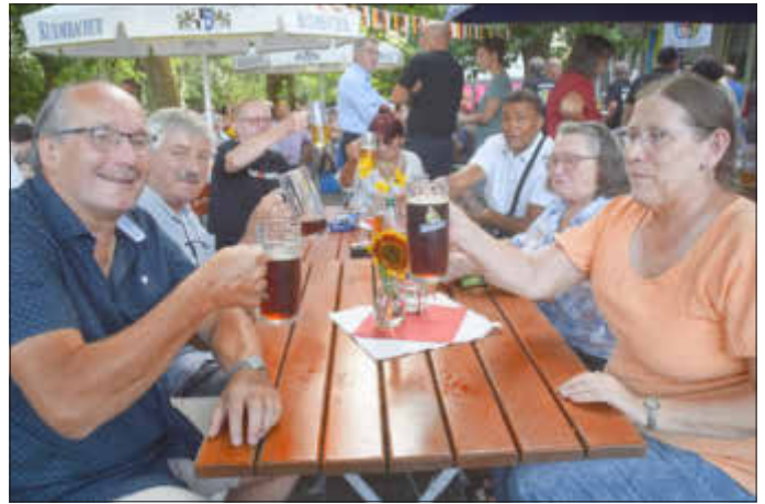
Das dunkle Koźlak schmeckte.