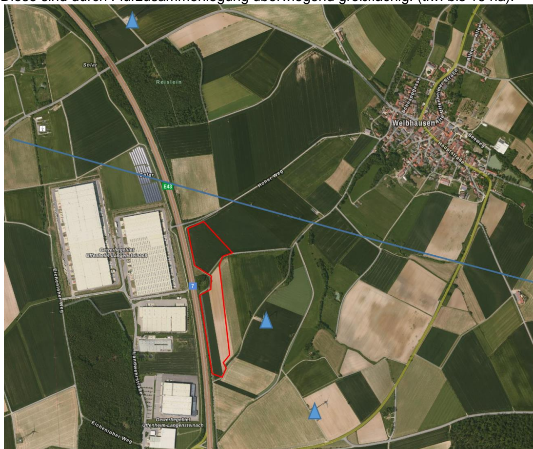
Abb. Solarpark " Nr. 58/2020 "PV Freiflächenanlage Welbhausen entlang der Autobahn A7" = rote Linie östlich der Autobahn A 7, blaue Linie 220 KV Leitung blaue Dreiecke = Windkraftanlage

Die geplante Anlage liegt auf einer landwirtschaftlich genutzten Fläche, auf der Ackerbau betrieben wird, umgeben von weiteren landwirtschaftlich genutzten Ackerschlägen. Diese sind durch Flurzusammenlegung überwiegend großflächig. (tlw. bis 16 ha).