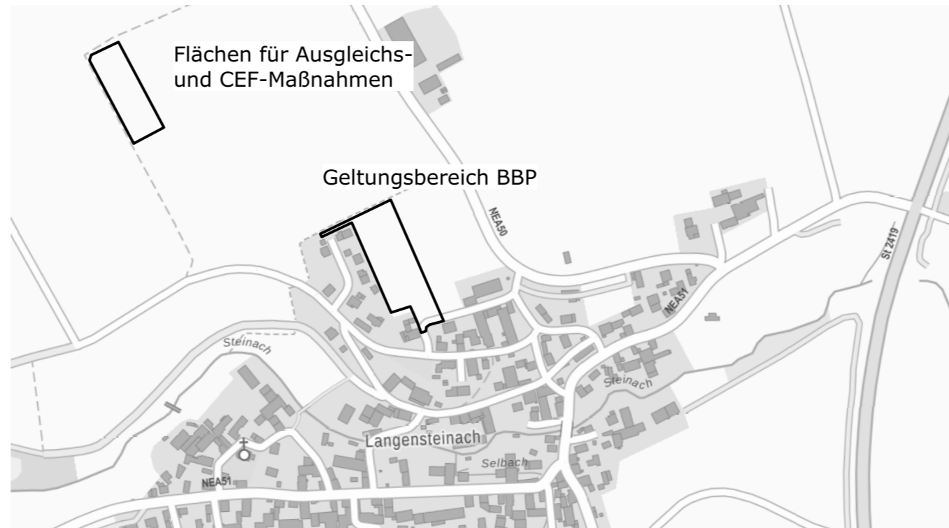
Lageplan M 1:6.500